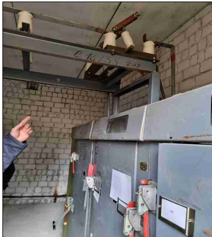
Шинный разъединитель II секции шин ЗРУ 10 кВ ТП № 159 (место происшествия)