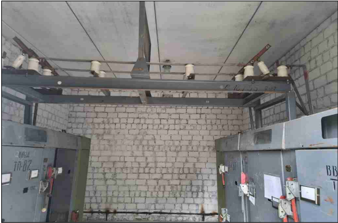
Секционная перемычка и секционный шинный разъединитель I и II секции шин ЗРУ 10 кВ ТП № 159